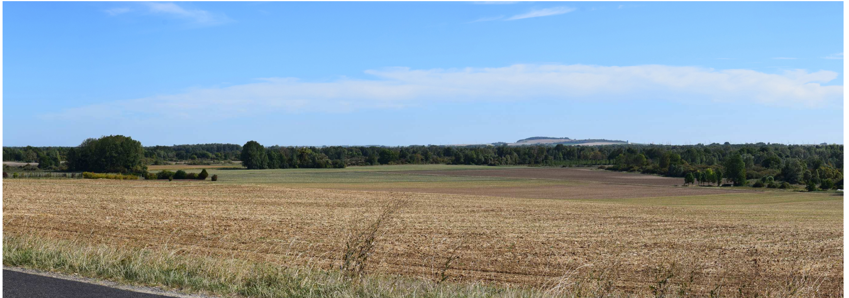
Le site actuel