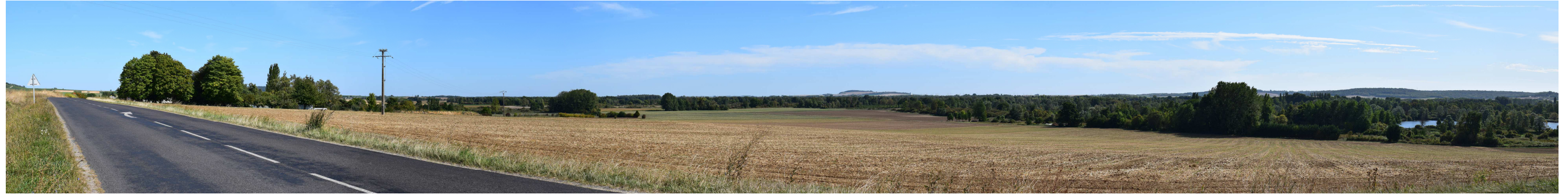
Le site actuel